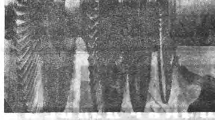
Совет прокуратурын 50 жэлэй ой