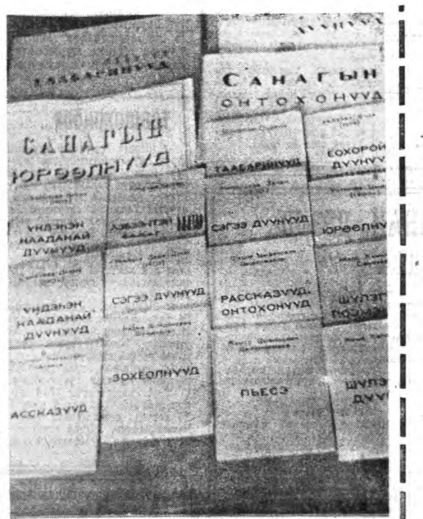
ЗУРАГ ДЭЭРЭ: «УРАН-ДҮШЭ» ГЭЖЭ ЛИТЕРАТУРНА НЭГЭДЭ-ЛЭЙ ГЭШҮҮДЭЙ «ХЭБЛЭНЭ» ГАР БЭШЭМЭЛ НОМУУД.