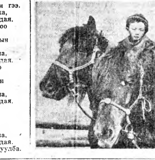
Түрхэн, гараһан нотагтаа Тулһиншгүйгөөр харихаш бэлэйб.