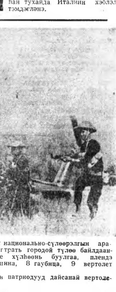
КАМБОДЖО. Камбоджийн национальсо-сүлөөлэгшын арадай зэбсэгтэ хүснүүд Кампонграттэ городтой түүлөө байлдаанда дайсадай 2.300 солдадууды хүлһөөн буулгаа, плендэ абаа. Дайсадай сэрэгтэ 90 машина, 8 гаубица, 9 вертолёт дайлан абанан байна.

СССР-эй байгуулагдаһаар 50 жөлэй ойн агууехэ һайндэрые совет арад хүсэ шадалайнаа түгэс ургажа байһан үедэ угтахан. Энэ гайхамшаг үдэр СССР-эй нацинууд ба арад үндэһэтэй нэгдэһы, Ленинскэ партине тойрэн тэдэнэй нягтаар жагсанхай байһы.