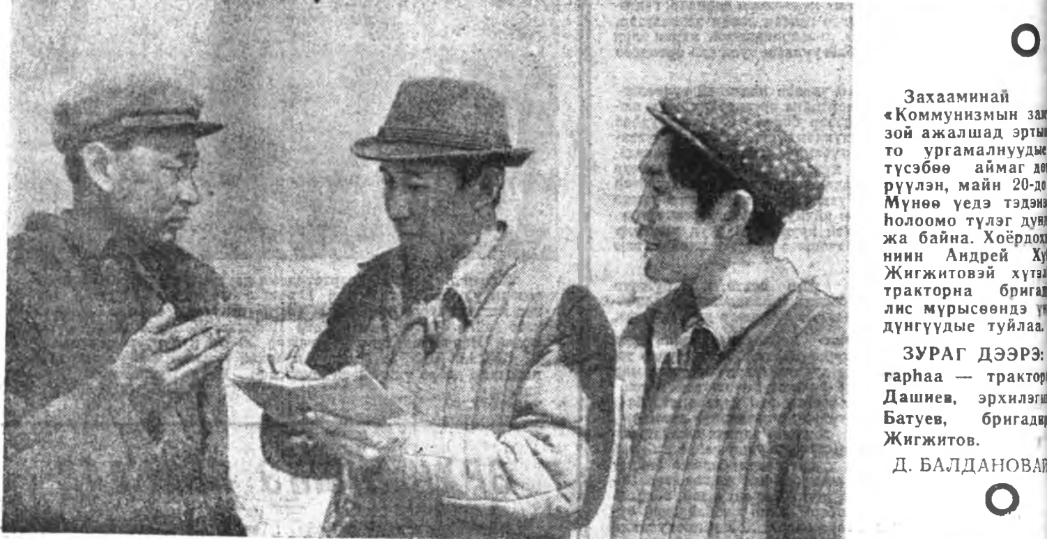
Захаамнай «Коммунизмын зам» ажалшад эрчимтэ ургамалнууды түсөөбөө аймаг дотор мунгэн, майн 20-до мунгэн үсдэ тэдэнэ голоомо түлэг дунда хэна байна. Хойрдоонин Андрей Ху Жигитовэй хуваа тракторна бригадис мурьсөөндэ үндүнгүүдэ туйлаа.