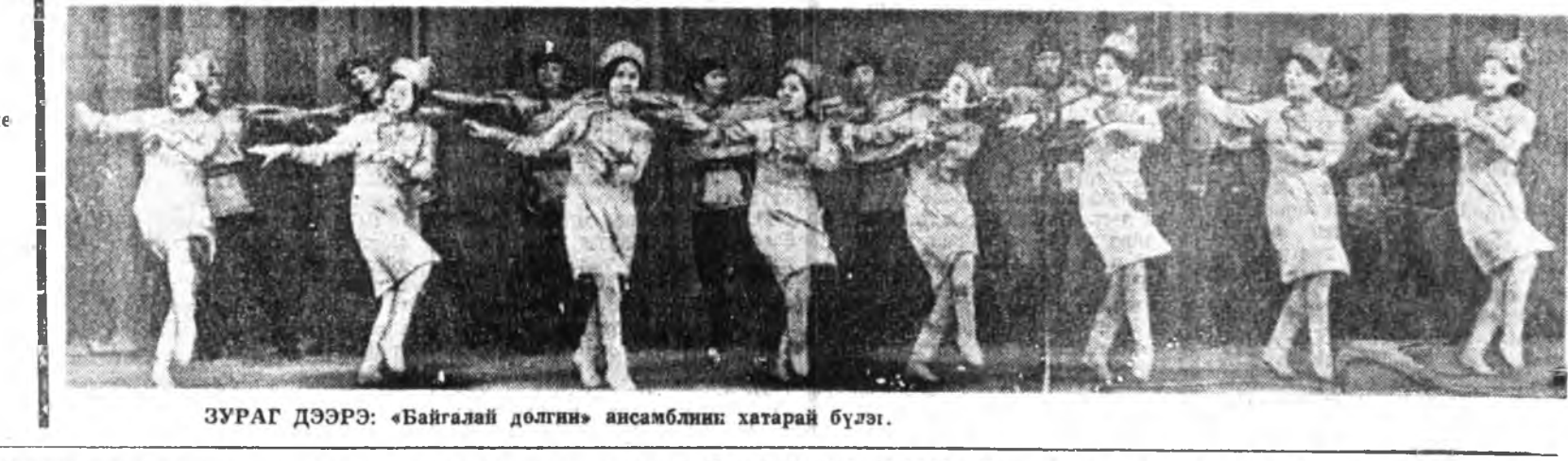
ЗУРАГ ДЭЭРЭ: «Байгалай долгин» ансамблин хатарай бүлэг.

Эдирхэн дүүхэм Энэ ариун мэдэрэлье Эрын хэмэй Элэг наадантай холин, Туршуулын дур, Түшгэжэнэн зүрхнэй сохисые Анхаржа ойлгонгүй. Арилан ошонбө хэшхэлгүй. Ногоорһон модол Номгон гудамжа дамжан, Эхэ байгалиин, Эрьсэ дабтан байхадань, Үдын нэрэг Үрхэ дээрэ мандажа, Хабар сагай Халуун элшээр наадана. ...Газгаа мүнөө Гасалтан, жаргалта хабар. Гансал зүрхмин Гажарна, хэнийшьеб үгүлэн.