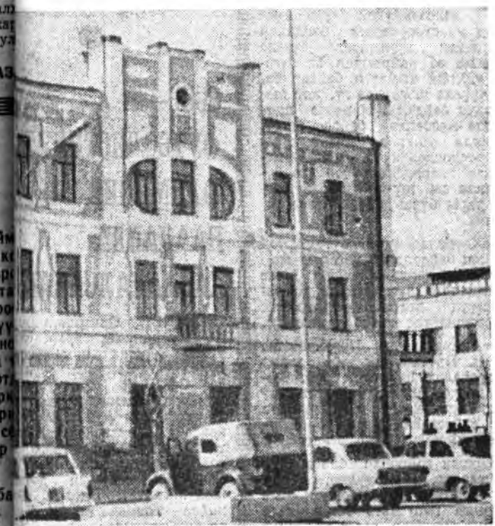
УРАГ ДЭЭРЭ: Лениний болон Сүхэ-Баатарай нэрэмжэтэ үйлэ бэлхэртэ (почтамын байсангай урда) оршодог ордон соо БГПИ нэгдэжэн. Мүнөө тэндэ спортфак худэлнэ.