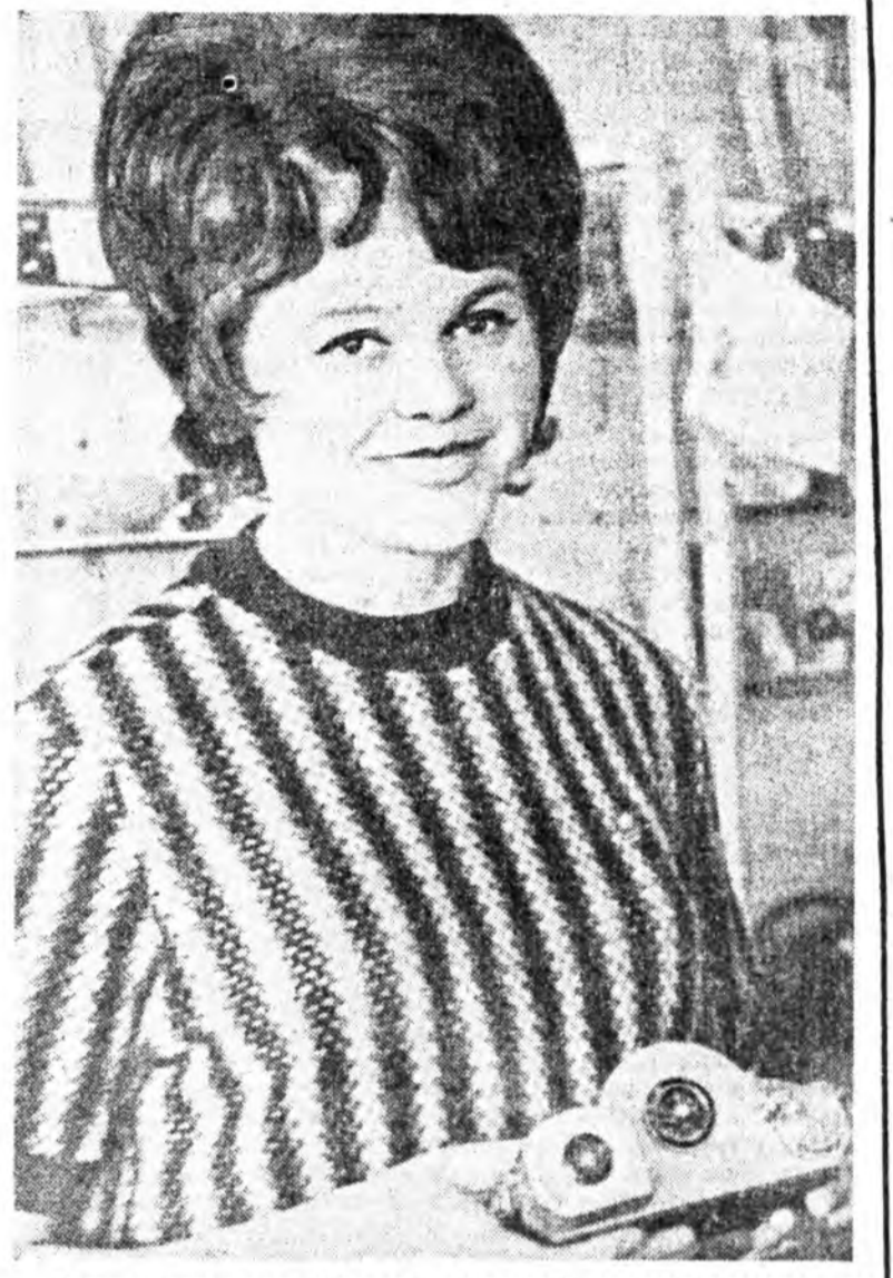
Зогорск тосхондохин 30-дахь магазиннай худалмэрилэгшэд худалдан абгаһында найраар, гүрэнээр хангалтын тула худалдаа наймаанай зал соо нээмэл дэлгүүр түхээрэнхэй.

СССР-эй «А» классай футболистуудай хоёрдохин бүлэгтэ наадаг футболистуудай дунда юнхэдэхи уулзалга үнхэргэгдэбэ.