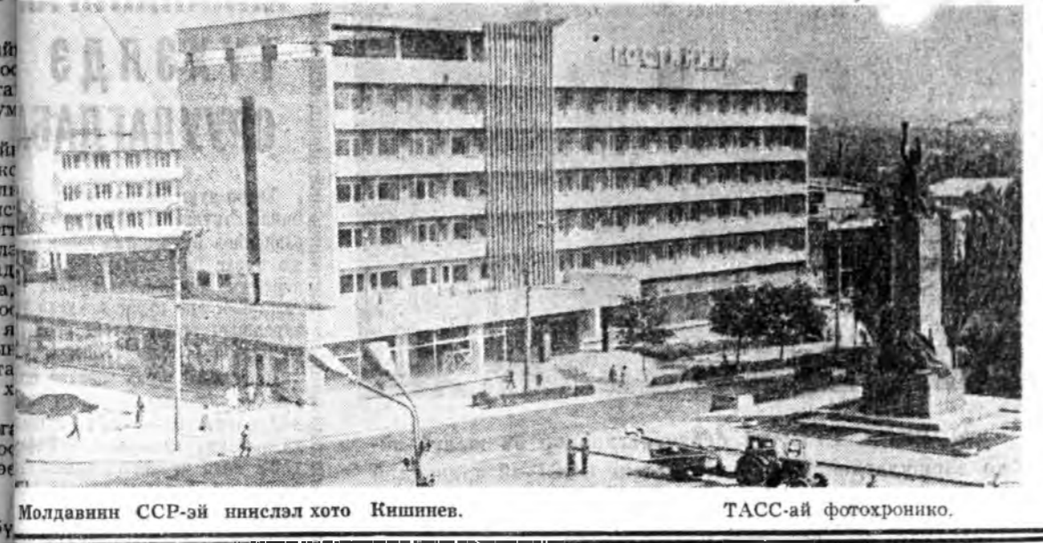
Молдавиян ССР-ий нийслэл хото Кишинев. ТАСС-ай фотохронико.

СОВЕТ Социалист Республикалууудай Союзай байгуулагдахаар 50 жэлэй ойг хөхө байдрыг анжал амжалтаар олон үндэс яһатанһаа бүрэн манай Эхэ ороной дайна-дурдан түргэн бата найдамтан, СССР-ий XXIV съездын хараалан ба болһан программыг бодото дээрхэ бодлуудай байһан коммунизм туулагуудай нанал бодол, хүдөөрмэлзэл болон амжалтай эрхэмлэлта амжалтануудар иэдэ-мүүд эзэлэгдэнхэй. Тус про-