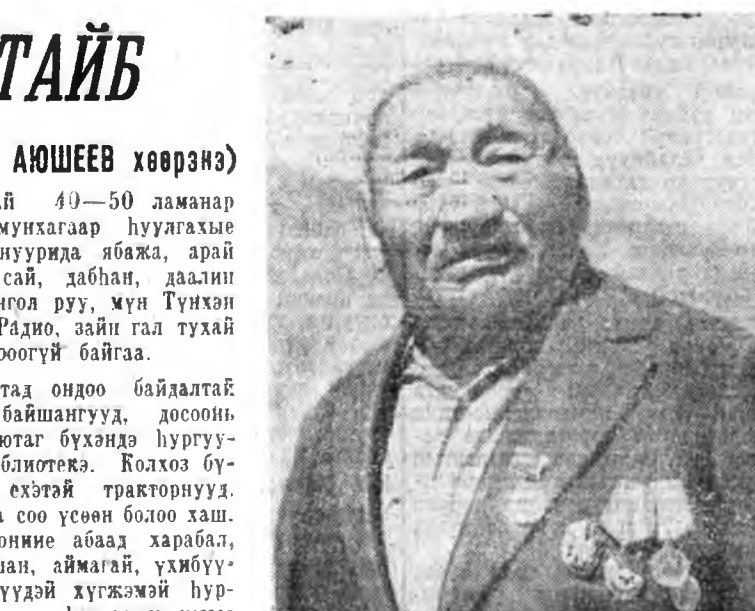
Золтойб даа, жаргалтайб

ялалтайб. Балагтын дасанай 40—50 ламанар лэ хүн зонинэ харанхы мушкагаар һуугахые һэдэрдэг байгаа ха юм. Агнуурда яважа, арай шамэй гэжэ олоһон олоһоо сай, даһан, даалин болгохын тула Эрхүү, Монгол руу, мүн Тунхэ морёор ошодог байгааһи. Радио, зайн гал тухай ханаа зүүдэндэмнайшье ороогүй байгаа.