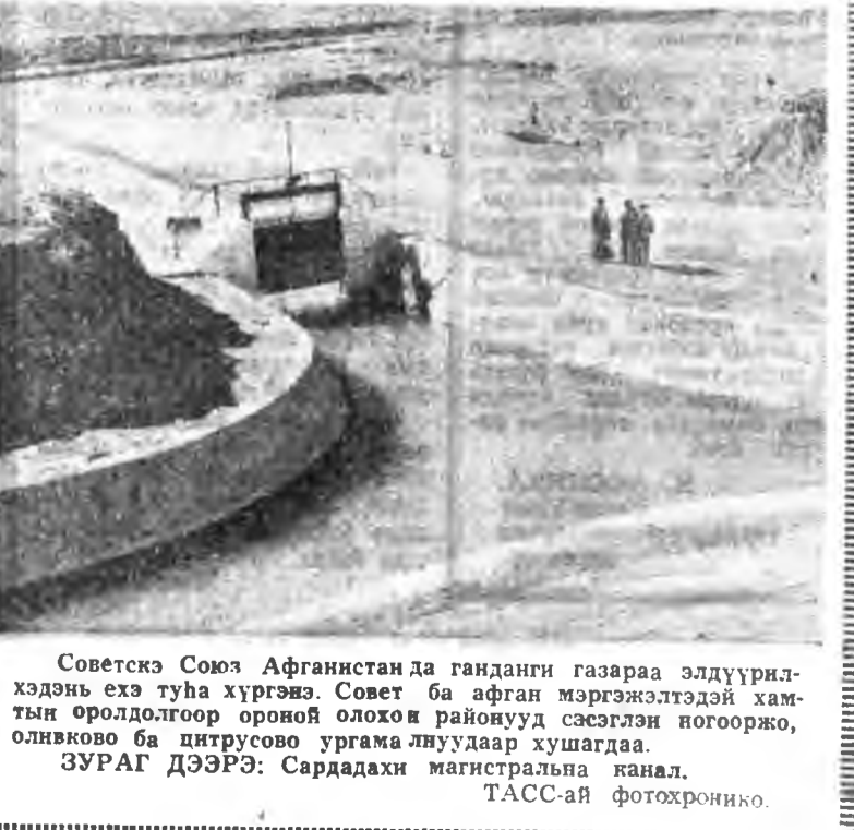
Советскэ Союз Афганистан да ганданги газараа эдүүрилхэдэнь ехэ тула хүргэжэ. Совет ба афган сэрэгтэ хэлсэгдээдэй хамтын оролдотгоор орой ойлохо районууд мэрэглэн ноогоорой, олдиково ба пнтрусово ургана луудаар хушгада. ЗУРАГ ДЭЭРЭ: Сардадах магистральна канал.

ТАСС Урда Вьетнадахи үшөө нэгэ американ авиаза ракетээр наһаа буулдага гэжэ ЮПИ агентствын корреспондент Сайгонохо дамжуулба. Августын 3-да Данангдахи сэрэгэй аэродромы патриодууд буудба. Тинхэдэ американ сэрэгэй олохон алба хашады хүлхөөн буулганан, шархатулан байна. Гурбан вертолет наһаагдаа, албан зургаанай шөрүүдэ нийдэхэ-буулгын талмай надаргагдаа. Базада дүтхэн эшгээлхэн дахуул ар-министр постдо, Данангда хоронхон сэрэгүүдэй бэхилгэ-нүүдтэ патриодууд хэдэн дахин довтолжо, тэдэнине ехэ гэгээтэ хоролтодо оруулаан байна.