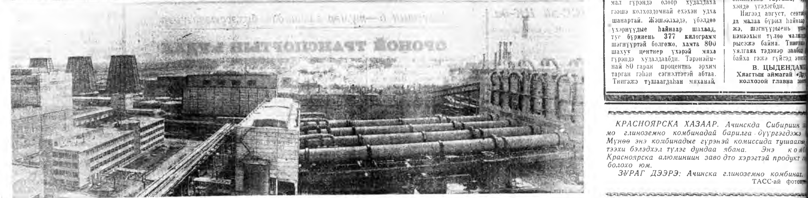
КРАСНОЯРСКА ХАЗААР. Ачинскда Сибириин мо глиноземно комбинатадй барилга дүүргэгдэжэ. Мүнөө энэ комбинатые гүрэнэй комиссида тушаахы тээхи бэлдэхэ түлээ дунда ябана. Энэ комбинат Красноярск алюминийн заводто хэрэгтэй продукт болохо юм. ЗУРАГ ДЭЭРЭ: Ачинскда глиноземно комбинат ТАСС-ай фото.