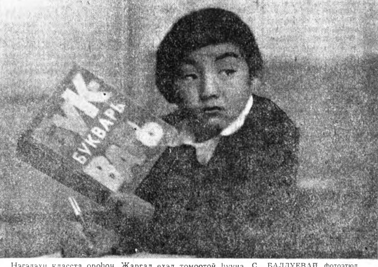
Нэгэдэн класса ороон Жадгал ехэл томоотой йвүна.

Таряалдагч ахамд ороод байтарай, манай хүршэ аймаг Мухар-Шэбэрэй «Икра» колхозой хурдан арбаад комбайн, машинанууд үдэр, бүнгүй хүнхилдэн, механизатор, таряалдагч ургуулан таряагаа гонзогоршье хоолоо, монсогоршье орооно гэжгү хураалхын түлөө уламалтайгаа абаха тухагүг хүдэлнэ.