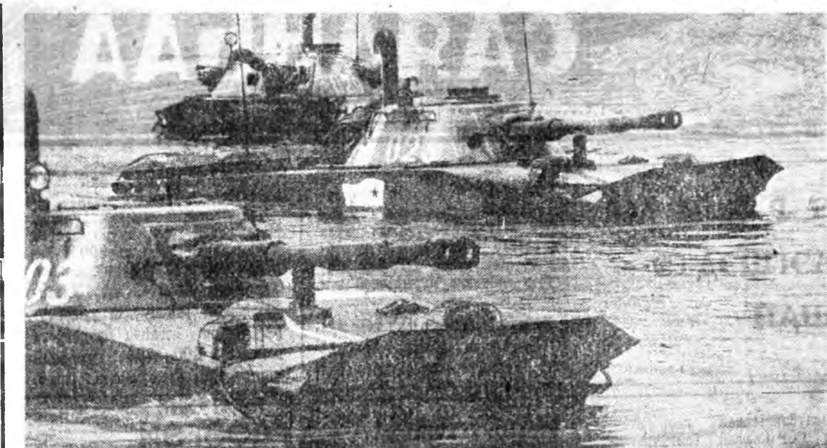
«Юг» гэж сэргээг хуралсал. ЗУРАГ ДЭЭРЭ: танкистүүд далай гатална.

Танкистүүдэй үдэр гансахан мунөө алба хөжэ байһан сэргээ- хэй байндор бөшэ. Энэ үдэр ха- даа танкова сэргээдэй хүсэ эхэт дайшаалы техникэ бүтээ- шэдэй, Эсэгэ ороноо хамгаалгын Агуухэ дайны жэлүүдтэ броне- танкова сэргээдэй эргэдэ аба- жа гаршан совет хүнүүдэй зан- шалта хайндор мүн.