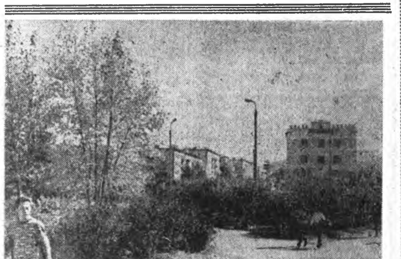
«Дружба» кинотеатрай урда тээхэ сээрэлиг.

Түргөөр бусалхан сайгаа уужа нуухада: «Мүнөө удэшлэн түб тосхонхойд шэнэ ехэ клубта бага хэхгүй багтажа ядатараа сугла-раад, концерт харахан гэшэ. Те-левизортой айлууд телевизорэ унтарража байжа концертэд гүйл-дэхэнь... Харин шөөдбори хэдаа, бнид гансааран ганса Нархатын-