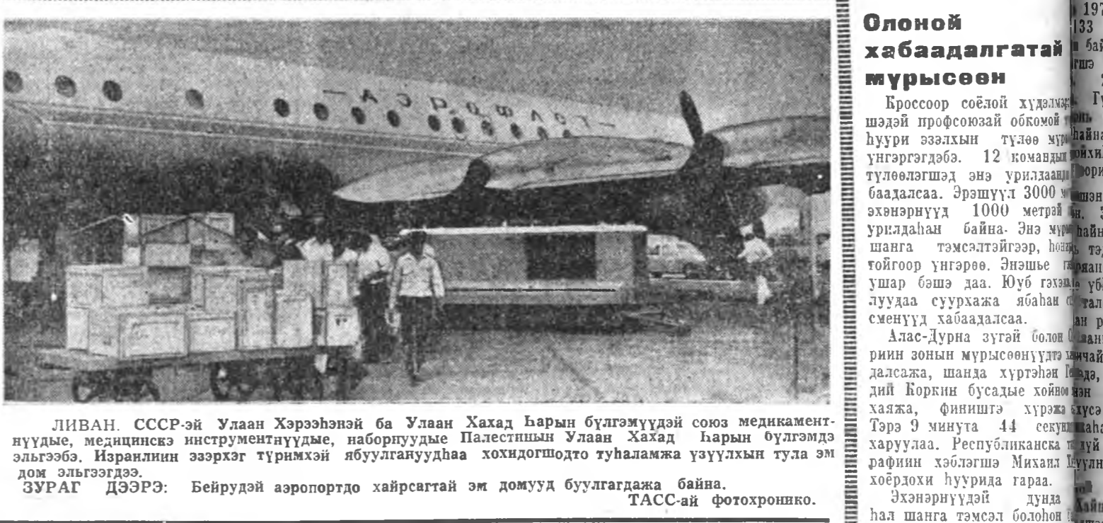
ЛИВАН. СССР-эй Улаан Хэрээнэй ба Улаан Хахад Барын бүлгэмүүдэй союз медициначуудые, медицинас инструментүүдые, наборуудые Палестинин Улаан Хахад Барын бүлгэмдэ эльгээбэ. Израилын ээрхэг түрмэжэй ябуулганууднаа хохидогшодто тунаамажа үзүүлхын тула эм дом эльгээдэ.

Матулович Хазетай тэнсээ. Глигорич—Гансия, Ивков—Рубинштейн гэгшэдэй партинууд хойшолуулагдаа.