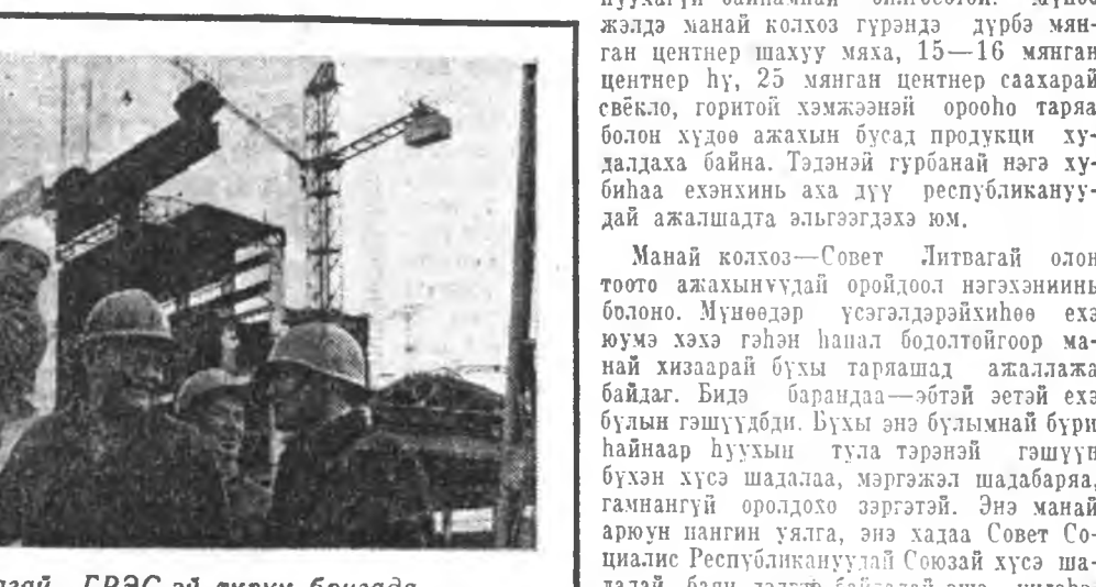
ЗУРАГ ДЭЭРЭ: Литвагай ГРЭС-эй түрүү бригада.