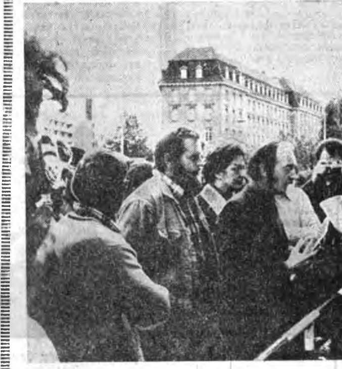
«Амур» футболуудай команданууд.