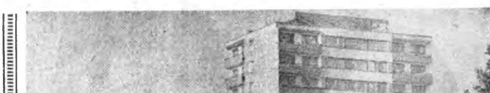
Вильнюс — Литвагай нийслэл хот.

Улад зоний нуудал байдал нилээд хайжаруулаха, тэдэнэй соёл культурын