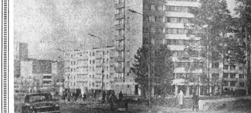
Эндэ гэр байранууд олоор барилгана.