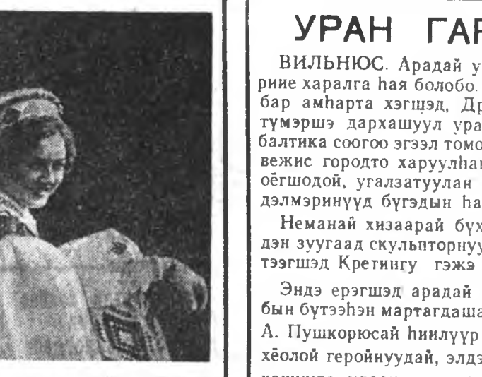
Жаралтай даа, Литвагай басагад.

Имагтал бүхэ совет республикануудай гайхамшаг тулалжамын ашаар Литва хүсэн түгэс мелиоративна техникэтэй болоо шуу. Ташкентин, Таллинай, Ковровой ажалшадтай эльгээһэн олон шангаатай эсквавторнууд манай колхоздо хайжаруулагдамал сабышалан, бэлшээрнүүдые байгуулаха, газараа үржээтэй болгохо үедэ хэрэглэгдэ нэн. Мүнөө жэлдэ хайжаруулагдаһан сабышалан дээрэ уһа саса-