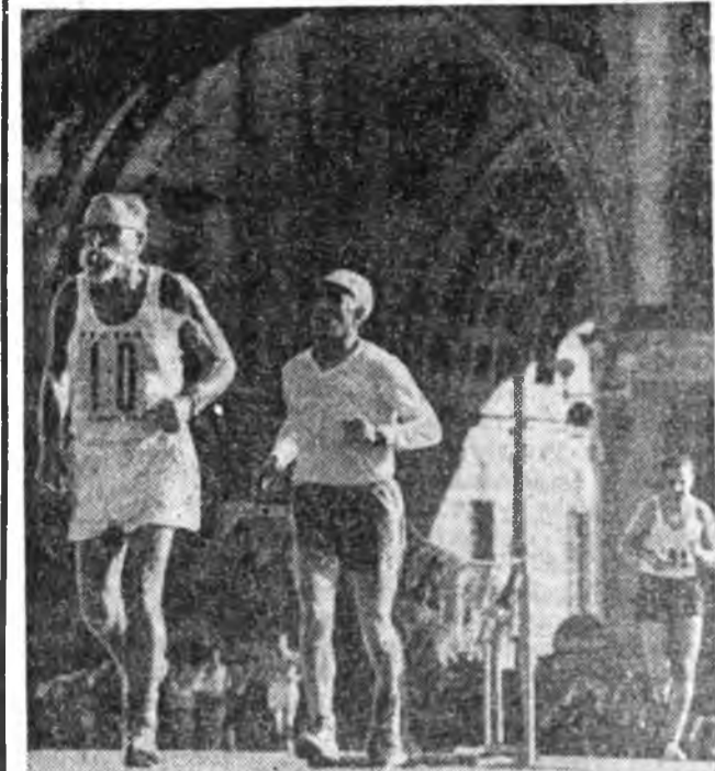
«ПАХТАКОР», «ШАХТЕР» — дээдэ лигидэ

«Би яажэ марксист болоо хэмбэй? гэһэн гаршатай Грузин түрүүшн революци- оно правительство толгойһон Филипп Махарадзе гишын дур- далганууд, Азербайджан уран зоһолон, партийна ба гүрэн- ый элитэ ажал аюуулагша, Советүүдэй Бүхэсоюзна 1 съездын делегат Нариман Ха-