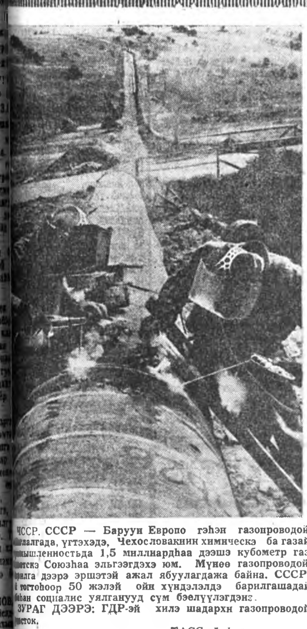
СССР, СССР — Баруун Европо гээнэ газопроводой агуулагдаа, үтэгдэхэ. Чехословакийн химическэ ба газарын хуралсалда 1,5 миллиарда дээш кубометр газ газартаа агуулагдаа. Мундэе газопроводой агуулагдаа дээрэ эршэтэй ажал ибуулагдажа байна.

Хуралсалда шэнэ жэлэй урда тээхэнэ пропагандаист-нарай семинар-зүлбөн үн гэрэгдэжэ, политическэ хуралсал эмхидхэхэ тухай хөөрөлдөгдөө.