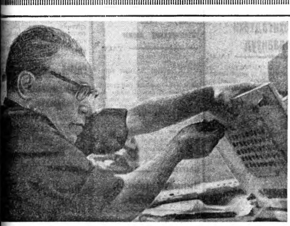
АРАД ВОНОЙ АЖАЛУУДА... ЛАЙ ХЭРЭГСЭЛ ХАНГАХА ХЭ...