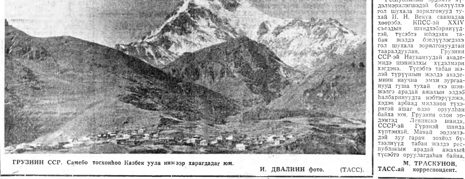
ГРУЗИИН ССР. Самебо тосхонхоо Казбек уула нимээр харагдадаг юм.