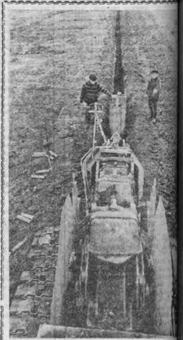
Псковско областин Палкинска районий колхозной правлин соо мүнөө эстон хэлэн дээрэ дөнүүдэй болохе дуулажа болоно. Юуб гэгдэ, сельхозтехникын Выпуска нэгдэлэй хорин мөш хэрэглэхэ гаран 350 центер газар турян газараа хэрэг туулаһан энэ эрээ. Мелитор газары мөө бургаанһан эсбэрлэхэ, 140 километр газарта 220 километр ута соргооуды таша ЗУРАГ ДЭЭРЭ: соргоонууды ташага байһан ТАСС-ай фотоһар.

Республикын Министруудэй Совет болон профсоюздай областной совет электрн элшэ хүсэ алмаһын түлөө предпринятинуудай дунда дэргэрхэн социалист мурьсөөнэй 3-дахн кварталай дун согсолон гаргаа.