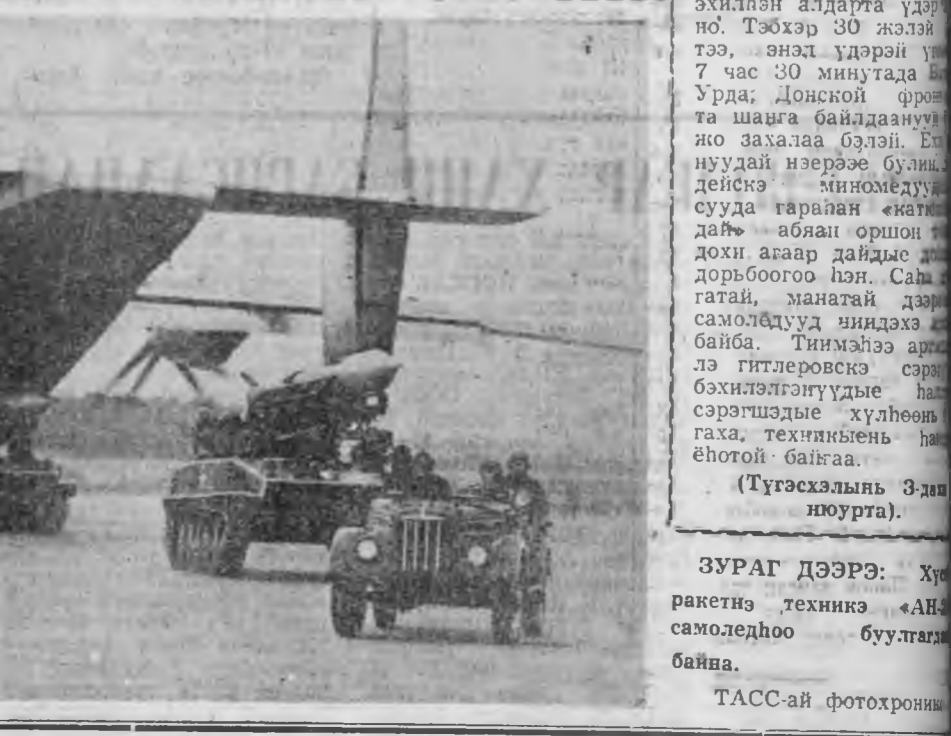
ЗУРАГ ДЭЭРЭ: Хүр ракетнэ техникэ «АН» самолэдһоо буулгаһа байна.

Энэ хайндэрэй хэзээ, хайһан гээд бин болонхой тухай хөөржэ үгэхэ гүт, нүхэр Советскэ Союзай маршал? — Совет ракетнэ сэрэгүүд ба артиллерийн СССР-эй Эбэ-сэтэ Хусунүүдтэй хамта алдарт зам гаталаа. Мүнөө тэдэ манай Эхэ оройн хүр хусан — тэрэнэй хуягынь болонхой. В. И. Ленинэй захла заабаринуудыне хүтэлэу байдалтай байһанаа өөрынөө хамгаалха хүсые бэрижүүлхэ, яһа барин сэрэгүүдые бүхы талаарнь хүгжөөхэ хэрэгтэ Коммунист партия, Совет правительствө гуйлай эхэ анхарал оролдого гаргана. Дайнай урда тээхи жэл нүүдтэ артиллерий хүгжөөхэ, тэрэнэй частынуудай ба соединенинүүдэй эмхидхэл байгуулажые хайнуулагдаа, элбэб тухэлэй зэбсүүдэ, нымэ ажамайые колхозууд, совхозуудта дамжуулаа. Алма-Ата. (ТАСС-ай корп.).