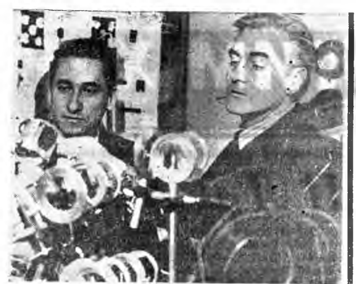
МОСКВА, СССР-эй Наукануудай академин Лебеде- вэй нэрэжэтэ Физическэ институтай квантова радиопи- зикийн лабораториодо Ленинскэ болон Нобелевскэ шангай лауреат академик Н. Г. Басовай хүтэлбэри дор кванто- ва электроникийн элдэб халбаринуудтаар шэнжэлгын эхэ ажал хэгдэнэ. ЗУРАГ ДЭЭРЭ: квантова радиопизикийн лаборатори соо.

Тэрэна Сирийн Араб Республикын хүдэлмэршэдэй проф союзуудай федерацин үс- хэлээр оройн промышленна предпритиянуудта үйлдэбэ рини эршэтэ нара сонсохон- донхой. Заводуудай цехууд бригада болон халаануудта продукци хэсэр гаргаха, тэрэнай шадар хайжааруула, тухээрлэ болон машин ануудые зүбөөр хэрэглэхэ талаар эхэ ажал хэ дэнэ. ЗУРАГ ДЭЭРЭ: Жүд нэхэдэ гүрэнэй «Дибси» гэжэ комбинатда.