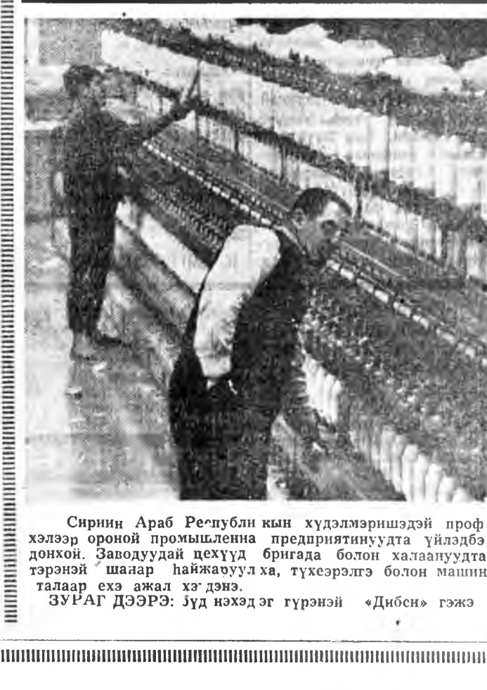
Сирийн Араб Республикын хүдэлмэршэдэй проф союзуудай федерацин үс- хэлээр оройн промышленна предпритиянуудта үйлдэбэ рини эршэтэ нара сонсохон- донхой. Заводуудай цехууд бригада болон халаануудта продукци хэсэр гаргаха, тэрэнай шадар хайжааруула, тухээрлэ болон машин ануудые зүбөөр хэрэглэхэ талаар эхэ ажал хэ дэнэ. ЗУРАГ ДЭЭРЭ: Жүд нэхэдэ гүрэнэй «Дибси» гэжэ комбинатда.