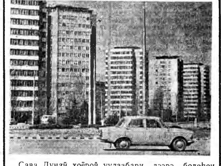
Сава Дунай хоёрой уулзабери дээрэ бодонон Югославин түб хотын район Шэнэ Белград гэжэ нэрлэгдэнхэй...