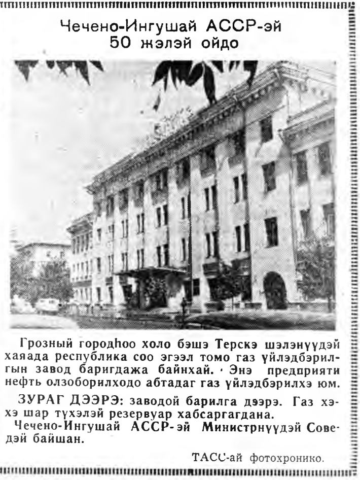
Чечено-Ингушай АССР-эй 50 жэлэй ойдо