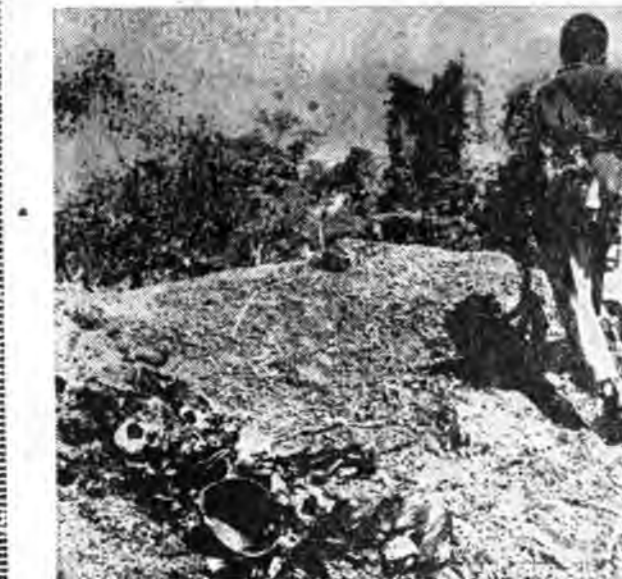
КАМБОДЖО. Оройной урда районуудта шанга тэмсэл үргэлжлээр. Арадай сүлөөлгэсэн хүсэвүүд №2 харын дэргэдэхэ райондо Пномпенин сэрэгүүдэй бүлэг солдадуудта шанга сохилто хээбэ.

Энэ үдэшлэн Кубын Революционий правительств Сальвадор Альендин хүндэлдэ Революцион ордон со сайлалга хээ. Кубын Компарти ЦК-гай нэгэдхи секретарь, Революционий правительствын премьер-министр Фидель Кастро, Республикын президент Освальдо Дортикос ба парти, правительствын бусад хүтэлбэрилгээд эндэ байлаа.