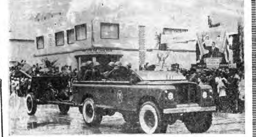
НЬЮ-ЙОРК Космонавтнууд хара дээрэ

талаар шэнэ арганууды бэдэрнэ. ЗУРАГ ДЭЭРЭ: 4-дхи ойн баярай хүндэлдэ болон сэрэгэй жагсаал.