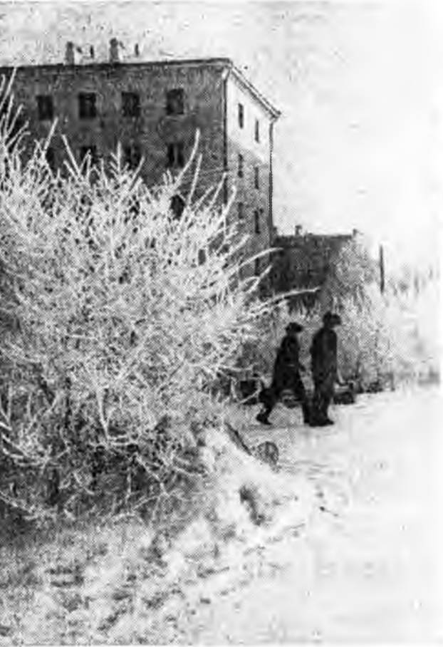
Убэлэй угалзанууд.

Зундаа ябадагта аляг гүгөөр үбэлдөө абажа бололтой. Зарим жолоодон харгын хуудайх канава уруу халтиран орожо үзэгдэнэ энэнине ойгодоггүйн хархат. Юуб гэхэдэ, тормозлогон машина шөөе хажуу тэмэ халтирдаг. Ганса тормозолохо бая, мун га эхээр дарабал гү, эл гансага газ бага болобод, яршэны хажуу тэмэнь баярдаг байна. Машинин халт тэмэжэ халтирдага заал иу хажуу тэмэнь оронон түснэй холбоотой. Мөөрүүдэй сн урлагша жүдхэжэ яогатарь охион болодог гү, аля халтирэн харгын, хонхосог халт тэмэнь оронон хүсэн болоо үгэнэ. Мун муу тормозтой хажуу хажуу тэмэнь шэрэжэ байна. Тинхээд халтирхай харгыда гаргын урмашиннаа хайса шалгажэ үзэ, харгыда гараад ябадаг, гүгэдэжэ абажа гүйлгэндэ айхотар нарилха шуудай. Харгыда аюул хэлхэгүй туга жолоодон бүхэн оромжон ёшотой бшуу. Г. ТОЛОКНОВА, ГАИ-гай инспектор.