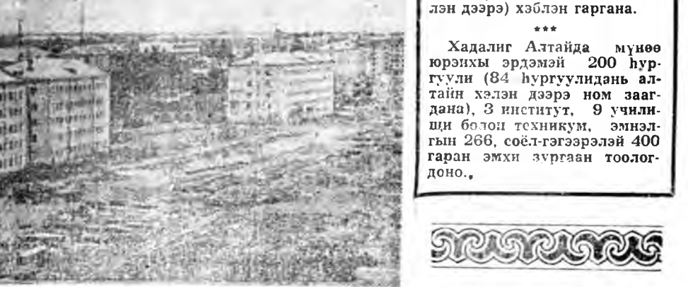
Биробиджан. Урган эхэ орономнай бүхи зах хизаарнуудта тон адыар үргэнөөр лбуулагдажа байнхай.

Хадалиг Алтайн малшад эрдэмтэдтэй хамта нүхэсэн худалжэ хомьдоһоноо ашагшамые эрнд дээршэлүүлээ.