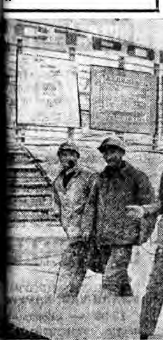
Туваасбест комбинат СССР-эй байгуулагдаһаар алдай ойдо зорюулан «хадын лен» олбоорилхоо тэжээ даабари болзорһоо нь урнд дүүргэб.

Тувын иинсэлэл хото — ашлэй багшанарвай институт, 168 дунда ба тухайла һуруулинуудта 60 ман бүхэндэ медицины худалмэрилэгшэ хүртэнэ. Тэжэлтэ эхэтэй капиталист эндэ медицинын хоёр эмэрлэгшэ аяар 1300 ие аргална бшуу.