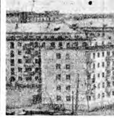
Биробиджан. Урган эхэ орономнай бүхи зах хизаарнуудта тон адыар үргэнөөр лбуулагдажа байнхай.

Хан холбоо барисаанамнай гэриш — жэлдээ жэлдэ олон шонэ айл гүрэнэй баруун хиизарнууднаа ержэ, манай Валдехийн һууринда түбхиһэнэ.