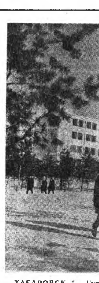
ХАБАРОВСК. Гүрэнэй физкультурын институтыдаи байшангууд.

4-дхи СМУ-гай барилгашад ойн байрта жалье ажалда амжалта туйлан үлөшо. Тэдэнэр тусэб, даабарияа сэг болзортонь дүүрэхтүн тулада галшагай дайнаар ажаллалан байна. Эзэби үүсхэл гаргажа ажаллаһаняага ашаар барилгашад болзортоонь хахад нара урд — декабрин 15-дэ