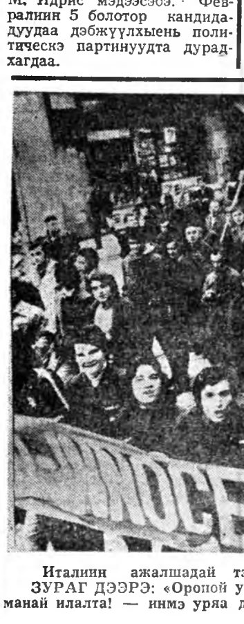
Италийн ажалшадай тэмсэл бүри шангадана. ЗУРАГ ДЭЭРЭ: «Ороной урда зүгтэ үлэсхэлэн байдалые үгы хэжэ», «Нэгэдэл — манай илалта!» — нимэ уряа

ЗУРАГ ДЭЭРЭ: «Ороной урда зүгтэ үлэсхэлэн байдалые үгы хэжэ», «Нэгэдэл — манай илалта!» — нимэ уряа