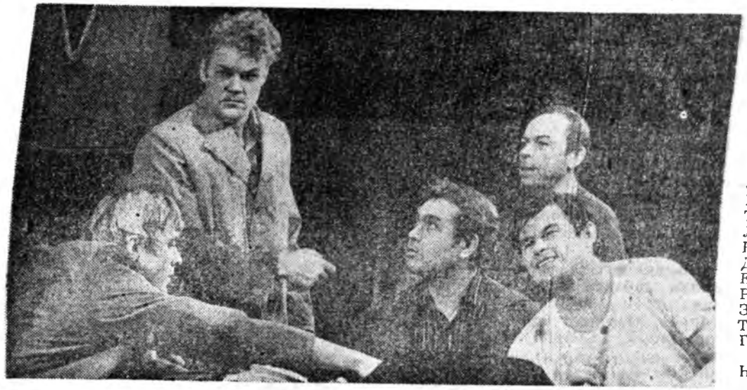
МОСКВА. ССР СОЮЗАН М. ГОРЬКИН НЭРЭМЖЭТЭ МОСКОВСКО УРАН БАЙХАНАН АКАДЕМИЧЕСКЭ ТЕАТР СССР-ЭЙ БАЙГУУЛАГДАНААР 50 ЖЭЛЭЙ ОЙН ХАНДЭРТЭ ЗОРИУЛЖА, СВЕРДЛОВСКИЙ ДРАМАТУРГ Г. БОКАРЕВОН «СТАЛЕВАРЫ» ГЭЖЭ ЗҮЖЭГ ХАРУУЛБА. ЭНЭ ЗҮЖЭГ ХҮНДЭ. ХАРИУСАЛГАТАН АЖАЛТАЙ ХҮНҮҮД — МЕТАЛЛУРГУУД ТУХАЙ ХЭЛЭНЭ. РСФСР-ЭЙ АРАДАН АРТИСТ О. Н. ЕФРЕМОВ ЗҮЖЭГ ТАБЯА, РСФСР-ЭЙ АРАДАН УРАН ЗУРААШИ И. Г. СУМБАТШВИЛИ ШЭМЭГЛЭН ГОЕГОО.