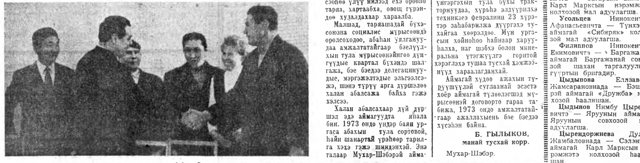
ЗУРАГ ДЭЭРЭ: мурьсөөнэй догворто гар таһинай һүүлээр.

НҮХЭР Л. И. ВРЕЖНЕВ МИНСК ЕРЭВЭ Нүхэр Л. И. Врежнев январин 11-дэ Минск ерэб. КПСС-эй ЦК-гай гэшүүдэ кандидат, Белоруссини КП-гэй ЦК-гай нэгдэхэ секретарь П. М. Машеров, Белоруссини ССР-эй Верховно Советэй Президиумэй Түрүүлэгшэ Ф. А. Сурганов, Белоруссини ССР-эй Министрүүдэй Советэй Түрүүлэгшэ П. Я. Киселев, Белоруссини ССР-эй Компартиин ЦК-гай бюорогэй гэшүүдэ, Белоруссини ССР-эй Министрүүдэй Советэй Түрүүлэгшын орлогшонор, республикын министрүүд, Белоруссини КП-гэй ЦК-гай хотын ажалшад түлөөлэгшэдэй харюусалгата хүдэлмэрилгэдэ, Белоруссини КП-гэй ЦК-гай, министрствануудай, албан зургаануудай харюусалгата хүдэлмэрилгэдэ, партиина ба совет эмхинуудэй хүдэлмэрилгэдэ, хотын ажалшад түлөөлэгшэд Л. И. Врежневые аардорон дээрэ халуунаар угтаба. (ТАСС).