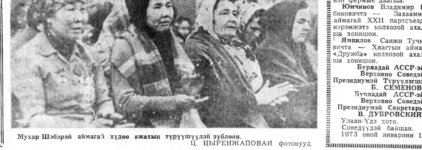
Мухар-Шэбэрэй аймагай хүдөө ажахын түрүүшүүлэй зүблөөн.