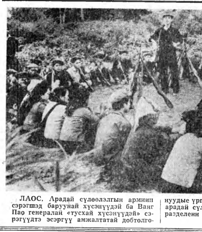
ЛАОС. Арадай сүлөөлэгшын армин сэрэгшэд баруунд хүсүнүүдэй ба Ванг Пао генерал «тусхай хүсүнүүдэй» сэрэгүүдтэ эсэргүү амжалтатой довтолгоонууды үргэлжэлүүлхээр. Зураг дээрэ: арадай сүлөөлэгшын армин нэгэ подразделени байлдаануудай залбарта.

СССР-эй байгуулагданаар 50 жэлэй ойдо зориулагдана КПСС-эй Центральна Комитетдэ, СССР-эй Верховно Советд ба РСФСР-эй Верховно Советд байрай хамтын суглан дээрэ КПСС-эй ЦК-гай Генеральна секретарь Л. И. Брежневэй хэһэн «Совет Социалист Республикатуудай 50 жэлэй үгтэй» элхлэхэл «Азиян олобо» хэлбэл япон хэлэн дээрэ брошюра болон, хэблэжэ гаргаба.