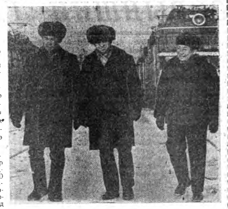
СҮҮДХЭДЭ — 1000 КИЛОМЕТР

РСФСР-эй Верховно Советэй Президиумэй Указ ПРОМЫШЛЕННОСТИИ, БАРИЛГЫН ПРЕДПРИЯТИЯИ, ЭМХИНУУДЭЙ ХУДЭЛМЭРИЛГЭШЭДТЭ РСФСР-ЭЙ ГАБЬЯТА УРЛАН НАРИЖУУЛАГША ГЭБЭН ХҮНДЭТЭ НЭРЭ ЗЭРГЭ ОЛГОХО ТУХАЙ Урлан нарижуулгын ажал ябуулада габьяа ехэтэй байһанайн түлөө промышленности ба барилгын предприятинуудай, эмхинуудэй булж худалмэрилгэдэ РСФСР-эй габьяата урлан нарижуулагша гэһэн хүндэтэ нэрэ зэргэ олгохо. БУРЯДАЙ АССР-эй: Глухосов Юрий Николаевич — Улаан-Удын АССР-эй байгуулагдаар 50 жэлэй ойн нэрэмжэтэ «Теплоприбор» заводай таһагай начальни. РСФСР-эй Верховно Советэй Президиумэй Түрүүлэгш М. ЯСНОВ. РСФСР-эй Верховно Советэй Президиумэй Секретарь Х. НЕШКОВ. Москва, 1973 оной февралин 1.