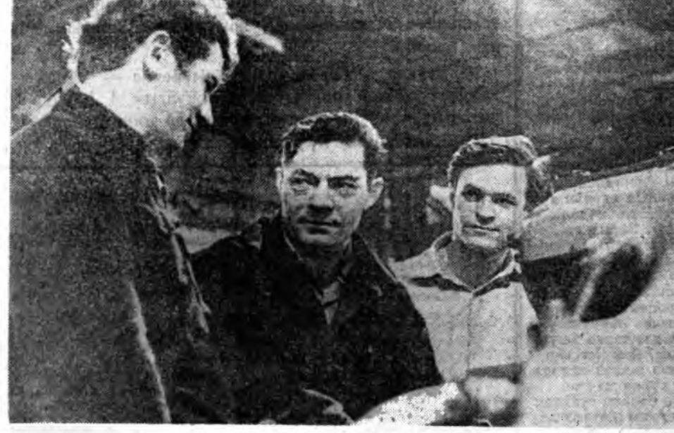
Түрүүшээр энэ хүн бүхэн хоёр-гурван станок дээр хүдмэлжэ нэн. Улаань дүрбэн станок дээр хүдмэлжэ боллоо. Тингэжэ Кировскэ заводой Социалис Ажалай Герой, КПСС-эй ЦК-гай гешүүн Евгений Иванови Лебедевэй хүтэлбэришэд шифовицнигуудай бригада хүн бүхэнэй ажалай бүтээсэ дээшлүүлжэ түсэб табижа, «Табан жэлэй түсэб» дүрбэн жэл соо» гэгэн уриа гаргалан байна. Мунөө энэ

Тийнхэнэ «Позитрон» хүдмэлмэришэд «Светлана», «Электросила» гэж нэгдэлтэй коллективүүдтэй сүг хамга шэнэ техника зохёохо, олоор үйлдвэрийлжэ ажил хуудмэлмэрин болзооры 1,5—2 дахин хороохо, продукцияг техникчесэ шанары эрид хайжаруула гэгэн үсхэл гаргалан бэлэй.