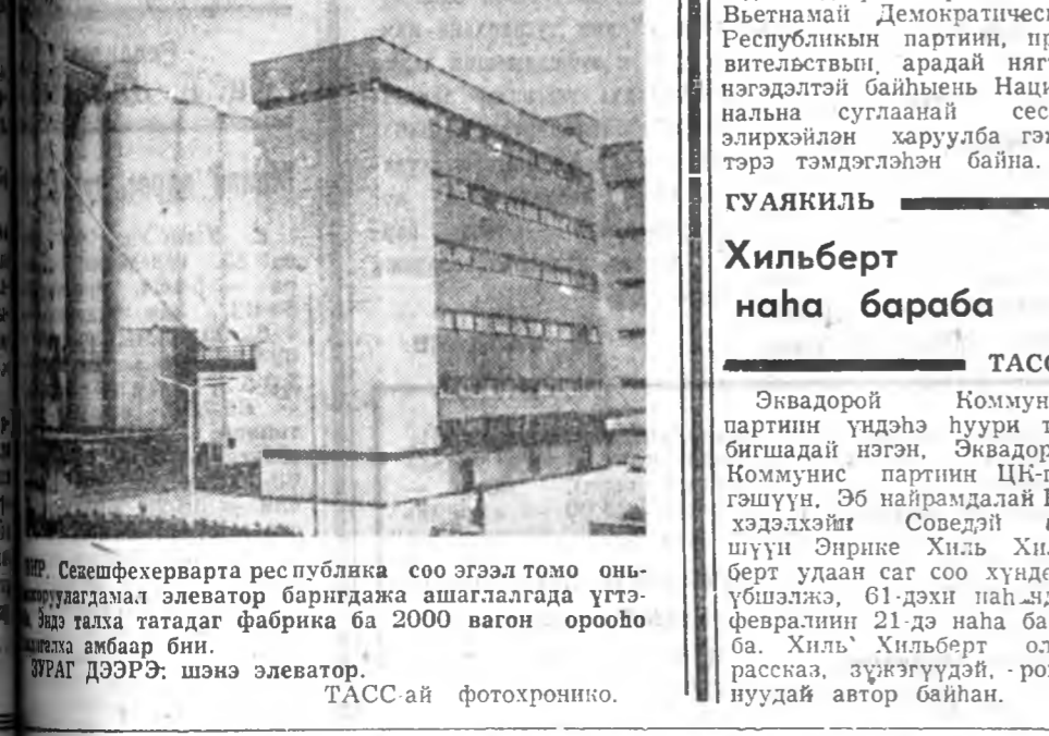
Сезефехерварта республика соо эгээл томо онынд дүргэдэ ашгагч элеватор баригада ашгаглагдахг үгтээ гэхэ тагтад фабрика ба 2000 вагон ороноо тэжээ амбаар бин.

МУРЕШЫН ШЭНЭ БУХАРЕСТ. (ТАСС). Ороной албан зургаангай ба соелой урдын түб болохо Тиргу-Муреш ерөнх туструнуд эзнэни Мурешэй үзэхэлэн гоё газар гэжэ нэрлэдэг. 30 мянган хүн зонтой энэ заахан хот эрадай засагай жэлнуудтэ 100 мянган хүн зонтой ехэ тоо боло.