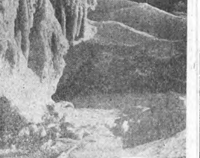
...Хабар болононой тэмдэг. Харгадаад байнал газарам.

Найруулан табигша режиссёр Ю. Н. Словохотов ехээн оролодоло гаргаа. Сценкин шэмэглэд эхэ байн.