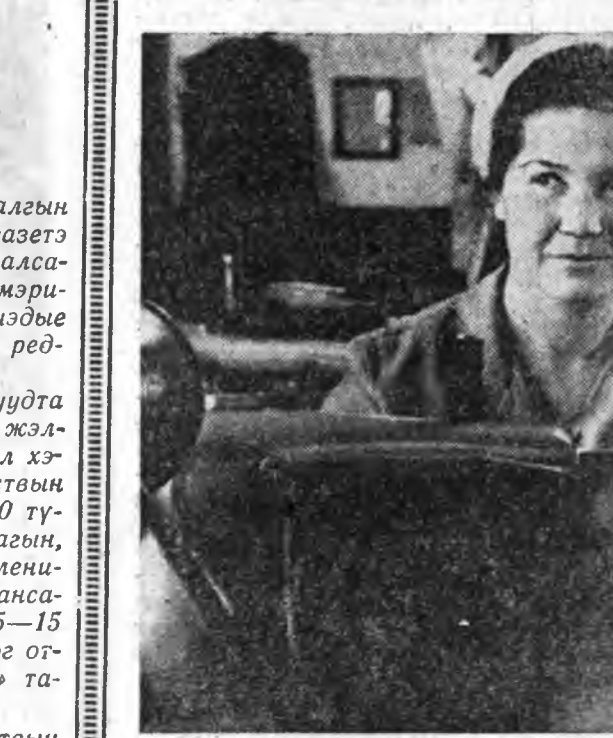
Эндэ хүдүлмэришэд эгэл уунэй предприятинуудай нэгэн болон. Тус заводой дүргэн цех булгайр арша элэн гаргаханаа гадна, бээлэй, хурган бээлэй, архан куртка, шархи гутал өдөг. Тус заводой коллентив хахад жэлэй түсэбэй дабаринаа гадуур 75 мянган дециметр булгайр арша элэн гаргах гэжэ шийдэбэ.

«Буряад үнэн» газетэ олоор тарагдаж юм. Энэ жэлдэ тус аймагай 1184 хүн манай газетэдэ захил хэбэн байна. Энэ аймагай «Союзпечать» агентствын начальниг О. Ж. Дариева редакциин зүгшөө 20 түхэригэй шанда хүртэбэ.