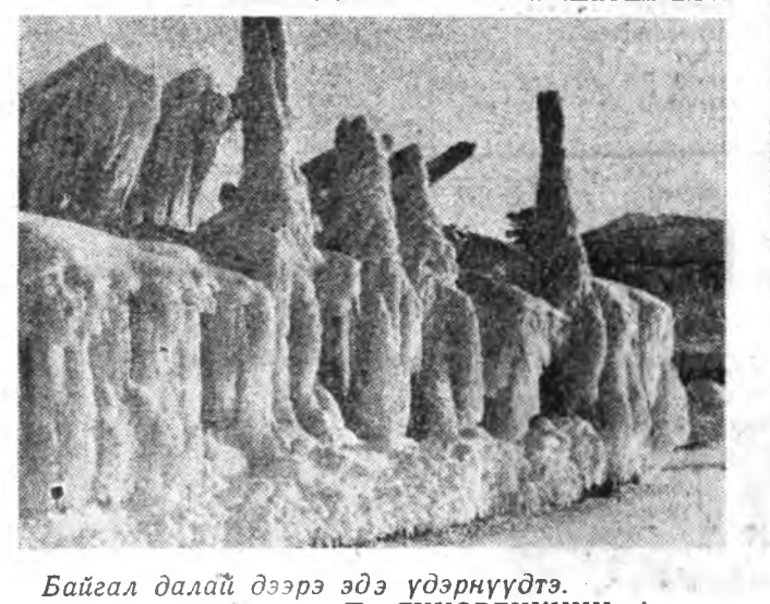
Байгал далай дээрэ эдэ үдэрүүдтэ.