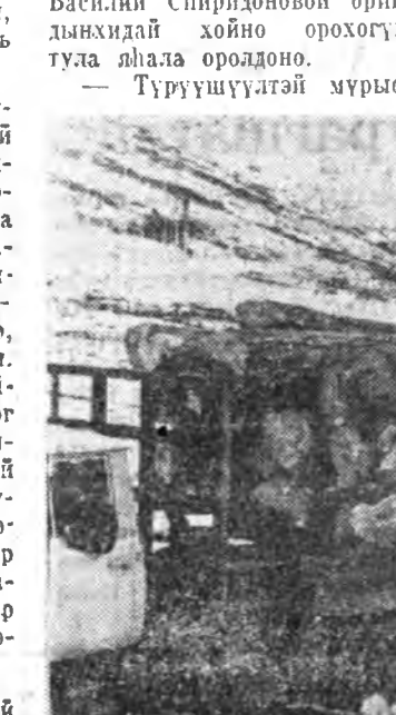
Василий Белохатовкой бригадын модошод шударгы...

Партийн райкомууднаа мэдээсэнэ ПРОПАГАНДИСТНАРАЙ СЕМИНАР