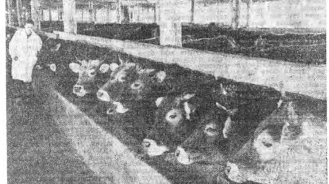
Дээдэ-Тори тосхонноо долоон модоной зайд Яаргалаантай нэгдэ оршодог...