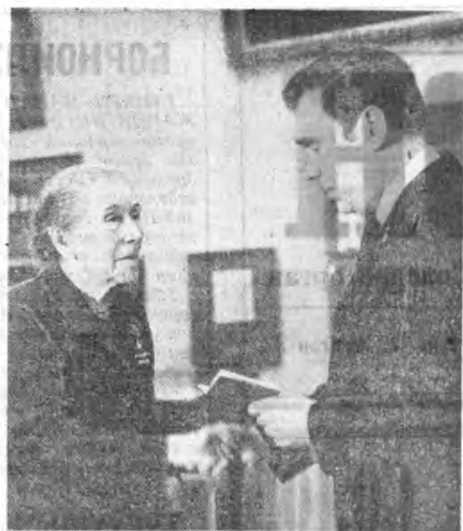
МӨСКВА. Уинэй коммунист, ородой түрүүшүн революцида, Агууехэ Октябрьин социалист революцида хаба...