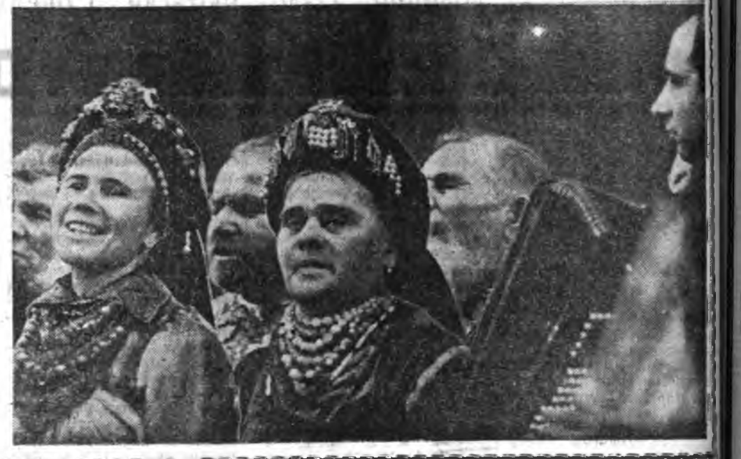
Улаан-Удын аймагай Ехэ-Куналейн шэмээшгүүдэй хоор тухай хураг суу холуур таранхай. Энэ үбэл болоһон уран найханай бүхэроссия харалга дээрэ энэ хоор лауреадтай нэрэ зэргэдэ хүртэба. ЗУРАГ ДЭЭРЭ: Ехэ-Куналейн хоор дуулана.

ЭНЭ ХУУДАНАМНАЙ УНШАГТЫ: БУРЯДАЙ ИСКУССТВО, ЛИТЕРАТУРЫН ҮДЭРНҮҮД. УГАН ШҮЛЭГЭЙ ДОЛГИН. Шог ёгто мүрнүүд.