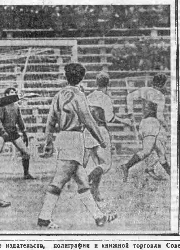
ЗУРАГ ДЭЭРЭ: «Сэлэнгын» футболистууд довтолжо яба-на.