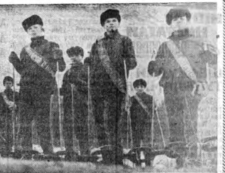
Залуушуулые патриот үзэлтэйгөөр хүмүүжүүлгэ

нууд болон тэдэннине хэрэг-лэхэ тухай худалдан абаг-шадта зүбшөөт үгэнэ. Ямар нэгэ материалдай магазинда үгы байгаа һаан, консуль-тантууд тэрэннине хананаа худалдан абаха гэжэ хэлэ-жэ үгэдэг байна. ВАРШАВА. Познань хо-тын барилгашад тур-шалгын гэр һалар зохёохо эхилхын. Гэр арадай Поль-шод байрын гэр барилгада шэнэ шата нээхэ юм. Проект зохёогчид шэнэ бүтээлээ «эрээдүйн гэр» гэжэ нэрлэ-нэ. Мүнөө барилдажа байһан гэрнүүдтэ орходоо, шэнэ гэр уужам салуу таһалгануу-