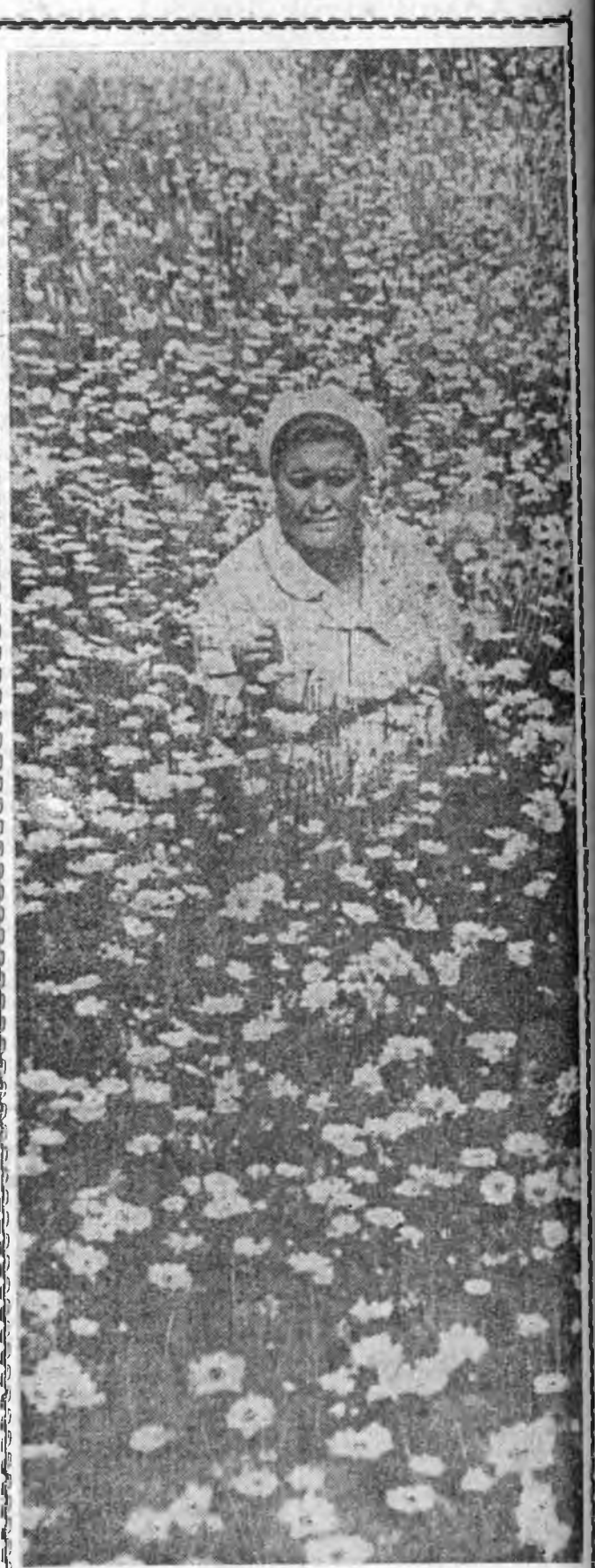
ЗУНАЙ САГ ЭХИЛЭЭЛ ДАА.