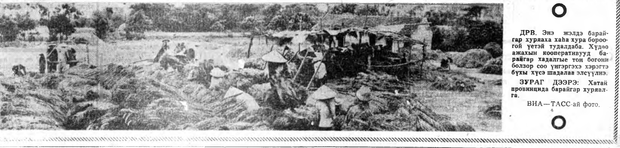
ДРВ. Энэ жэлдэ барилга хурааха хана хураабоорой үетэй гудалдаба. Худөө ажалын кооперативууд барилга хадгалыс тои богон болзор соо үнгрэгэхэ хэрэгтэ бүхы хүсэ шадлаха элүүлэнэ.

«Литература, искусство» гэжэн гаршаг дор «Шэмээгүйхэн антахамнай» гэжэ Борис Яранчский тууна хурангыгаар эндэ хэлбэлгээнхэй. Закарпатиин ажабайдал тухай тухай соо домоглогдоно. Юун тухай эндэ хэлбэлгээнб гэжэ уншагшад өһөдөө туужатай танилсаад, мэдэнэ ааба. Мун оройой энтэ драматург А. Н. Островскийн түрөөрөө 150 жэлэй ойдо зургаануудан Александр Шамаро гэжын станиц уншажа болоно. Уабегэй уран зохиолой эхи табигшад нэгэн Гафур Гулям тухай очерк болон бусад материалнуудай уншагшад танилсажа байха.