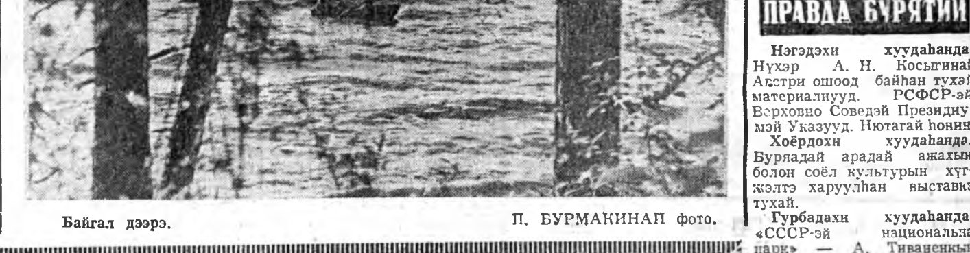
Байгал дээрэ.

Улаан-Удэ, Сөвөдүүдэй байшан. 1973 оной июлиин 2.