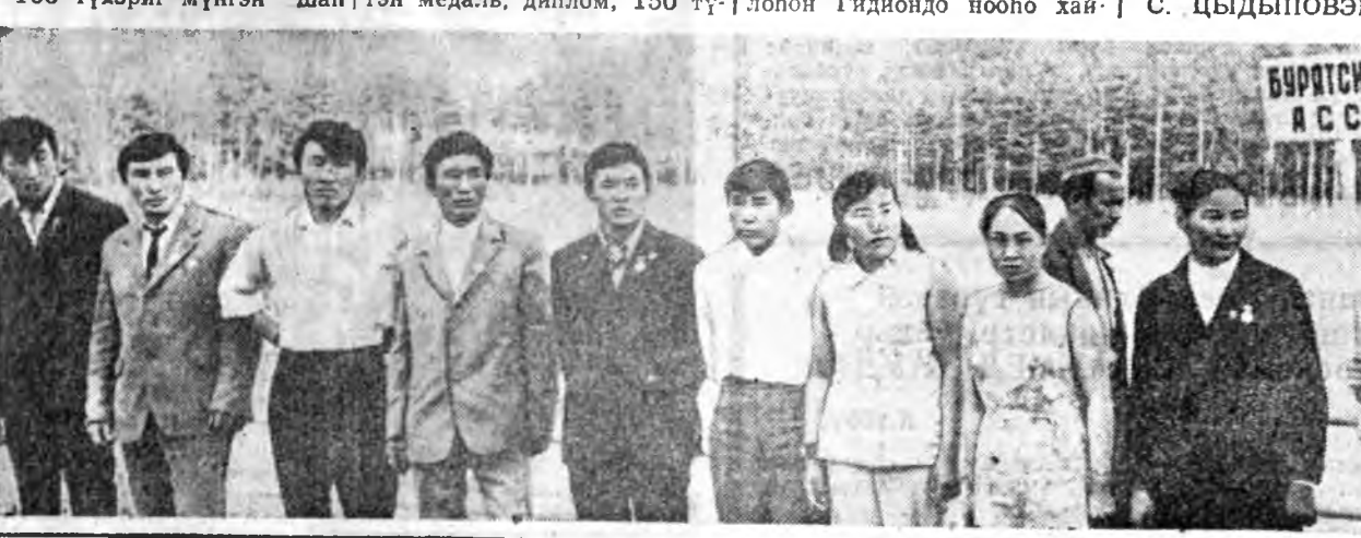
Мүнөөдөр—СССР-эй Далайн-Сэрэгэй Флодой үдэр

Улаан конкүрсын түгэсхэлэй жагсаал болоо. Конкүрсе дундаан бүхы 72 хайшашад трибунын урдуур жагсаба.