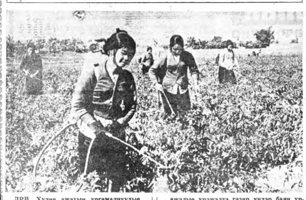
ДРВ. Хуөө ажахын ургамалуудыг тариха ургуулагда элэһэн тарышад ехэ хүсэ шадалаа элүүлгэ, оролдолог хэшээлгэ гаргана. Тарышадай багшагай ажалыг үржээлтэ газар үндэр баян ургасар харюулаа.

Тэрэнай аашалжа байхыг хаража байһан эхэнэрнүүд: «Барга лэ эрэ хаш, хаанаһаа эрээ гэшбэ? Томохон дарга хэбэртэй, Наймаалагшаднай одоол юумэндэ хүртэхэнь ха» — гэжэ байжа шөбөр-һабир гэдэнэ. Тэндэ байһан минни баһал: «Байжа, хаана энэ хунине хараа, узөө бэлэб» гэжэ бодож байтар. Алганта нотог ханаандаа ороод орхоб һэн.