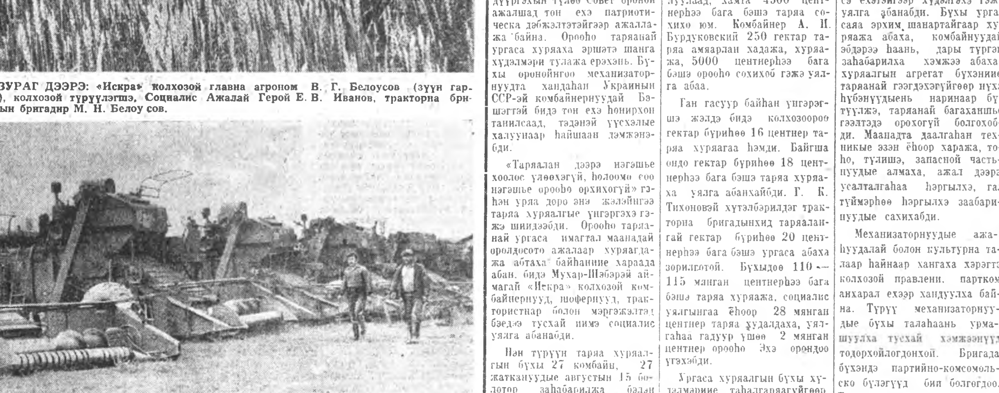
ЗУРАГ ДЭЭРЭ: колхозой заабарилгадан комбайнууд д жэрдэнэ.