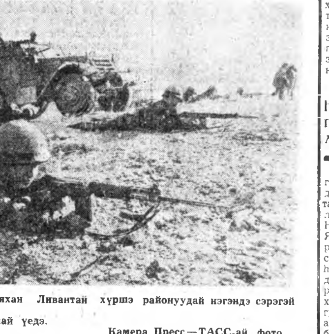
Израилин булмитаргаһад хаяхан Ливантай хүршэ районудай нэгэндэ сэрэгэй буралсал хэһэн байна.