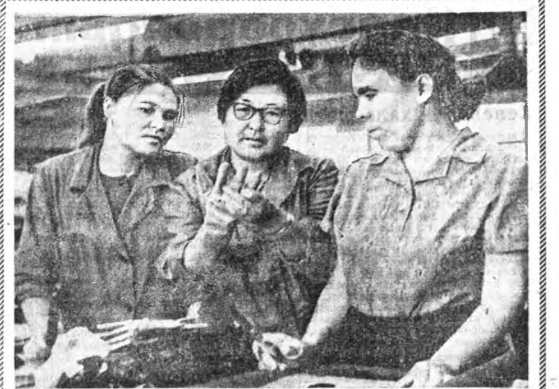
Танце ямараар ханганаб?

Улаан-Удны аймгай... ажалшад депутатудай