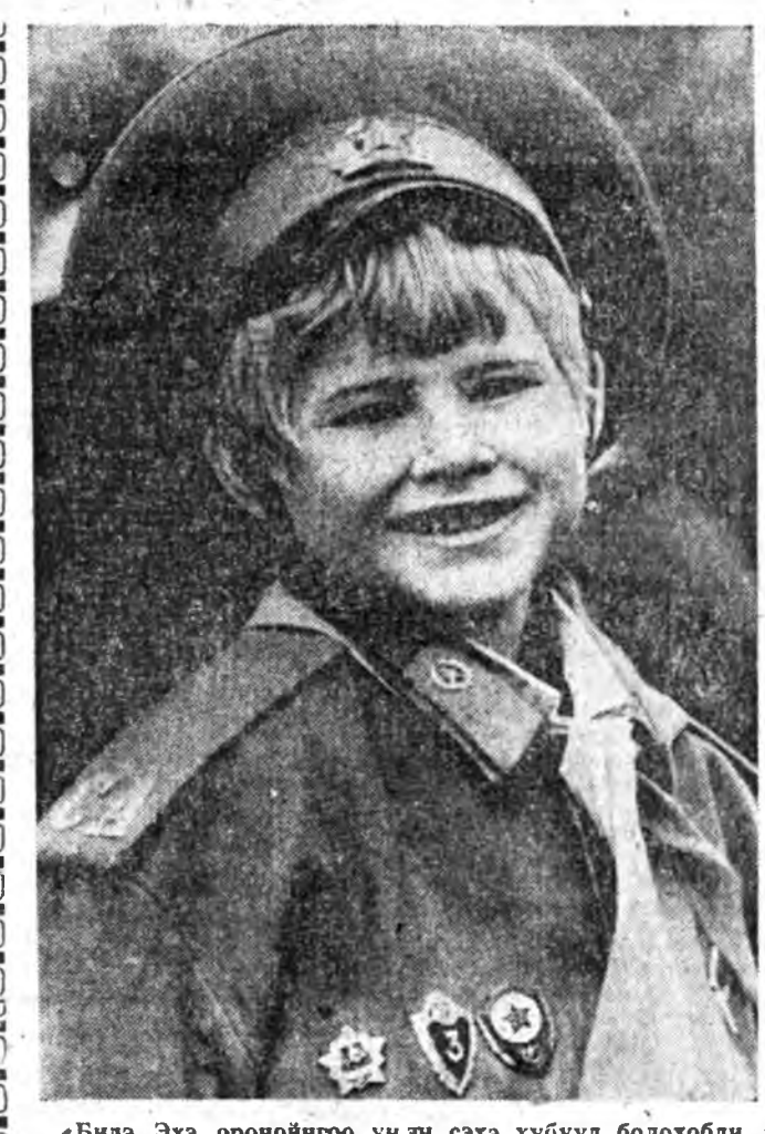
«Бидэ Эхэ оронойгоо үнэн сэжэ хубууд болохобди»

Дайша Дамбан хаан хубуунэй оншотой сэсэн харюуда сохигдожо, гайхалын ехээр гайхаба. Тингээд: — Ши бодол зоригтой, сэсэн хубуун байһан. Энээнэйш түдөө эринэн юумыш үтөөл, шини хөөрөө шагнахаб, — гэжэ хубуундэ хандаба.