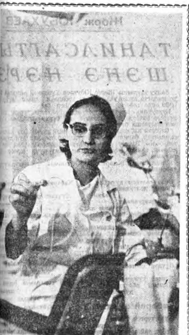
Улаан-Удмын Железнодорожно больницын дүрбэдхи сто- тологическа поликлиника шэна, харуул байшан соо орлодог. Нёдождо жиндэ ашгаллагда оронон энэ поли- клиниско медицинскы шэнэ түхөөрлэгүүдээр гүйсэд хан- галданхай. Эндэ дээдэ хургуулитай мэргэжэлтэд, 22 врач хуудалдог.