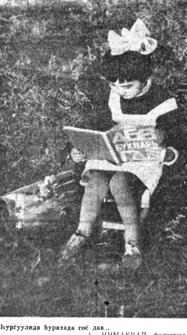
Хургуулида хурахада гой даа...