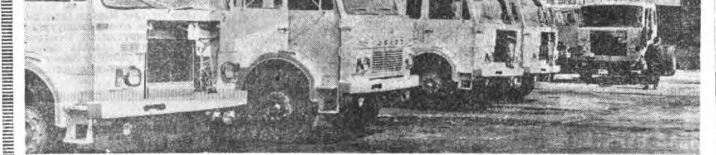
Польшын Авадай Республикада Ельчанска автомобильна заводые шэнээр үргэдхэн барилгада гурбан милли-ард шахуу элэтийн мунган зэрин һомологдобо. Энэ завод хадаа автобусууды бүтээн гаргадаг Европийн эгээл то-мозуудтай нэгэн болохо юм.

буудалдаа зогсооно, амгалан байдал нэргээхэ тухай Аюулгүйн Соводэй шийдхэ-баринууды бээдүүлхэ хэр-эгтэ нүдөөлхэ хомжөөнтү-дые Советскэ Союз абажа байна гэжэ ТАСС мэдүүл-хээр түлөөлгдөө. Уласхоорондын шахардуу байдал һуларуулгада һаад тоёо тагаха США-гай энэ алхам Советскэ Союзые ан-глан һүрдөөхэ дээдэлгэтэй байна. Иймэ зорилгоёе бээ-дүүлхын тула буруугаар хандабат гээд энэһэй үс-көшөөдтэ һануулаха хэрэг-тэй.