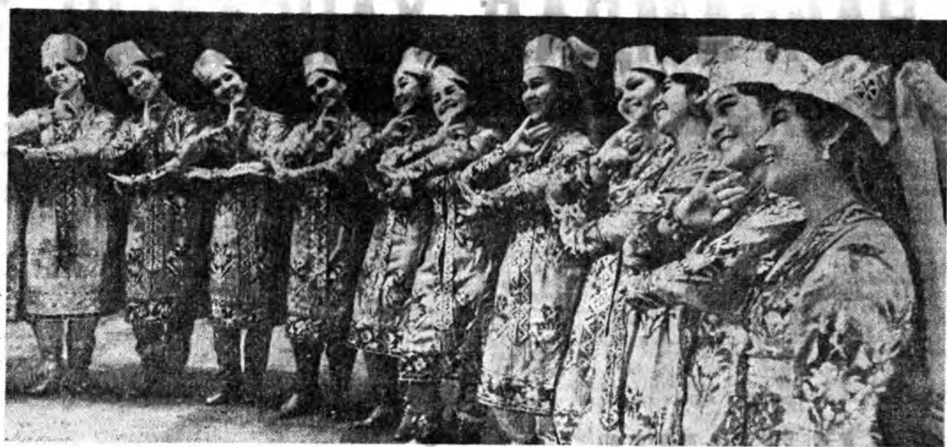
ЗУРАГ ДЭЭРЭ: «Багор» хатар.

«Багор» гэши оршууахада «Хабар» болоно. Тээд Уэбээл ССР-эй гүрэнэй хатарай ансамблин энэ нэрье хэндэе оршууланай хэрэггүй.