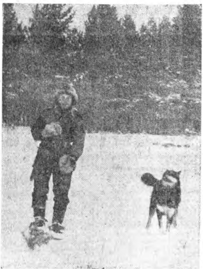
УБЭЛЭЙ ОЙ СОО

Сагаан харата хүннүүд Ягаан толон сонходом, Унтанхай будта. Хон-жа