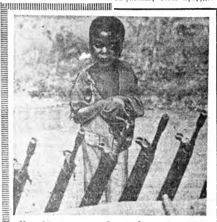
Мозамбикын нэгэ тосхоной энэ хубуун тэрнине үнш...