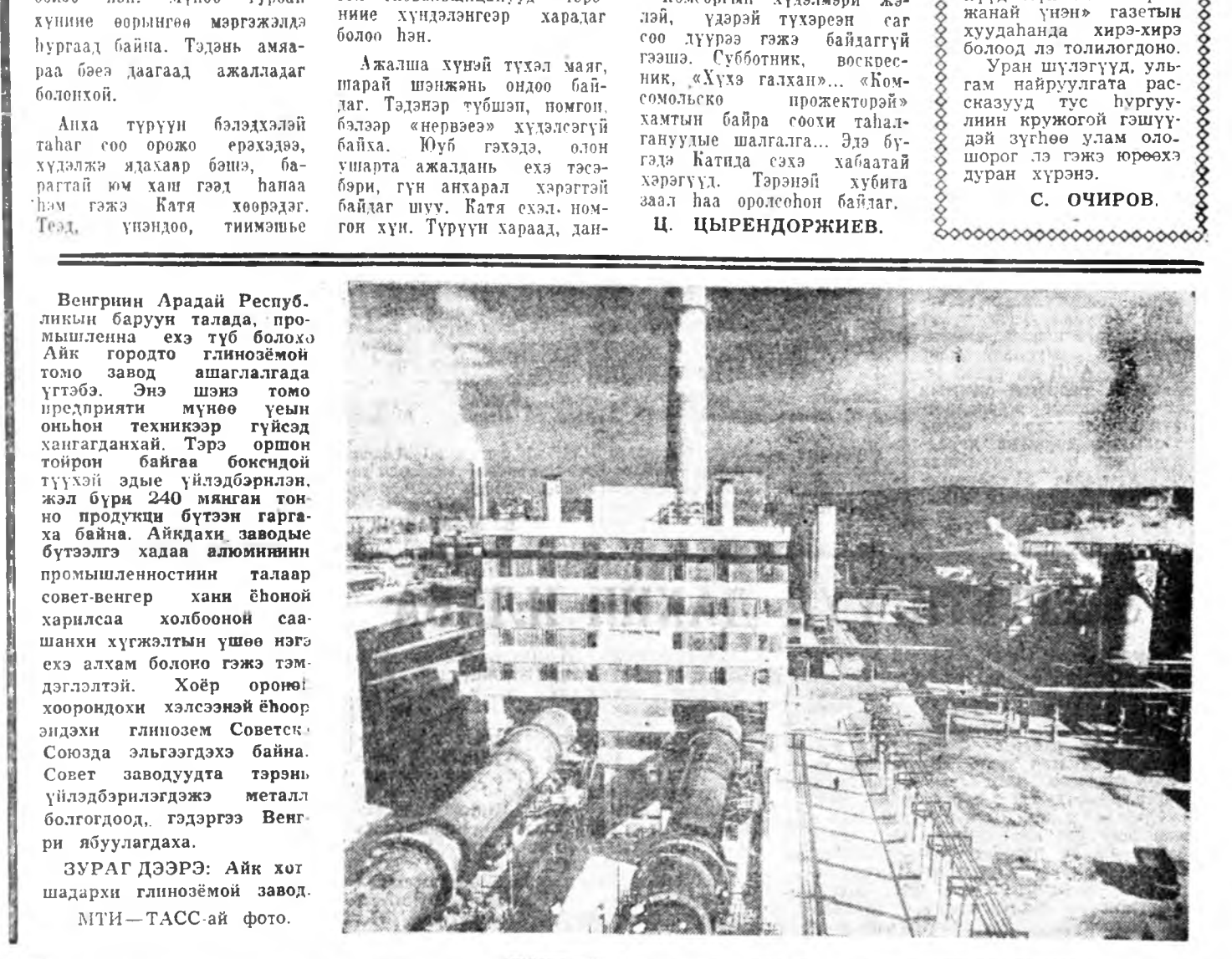
Венгрин Арадай Респуб. лийн баруун талада, промшленна ехэ түб болох Айк городто глинозёмной томо завод ашагларда үгтэбэ. Энэ шэнэ томо предприния мүнөө үеһи онһон техникээр гүйсэд хангалданай. Тэрэ оройно тойрон байгаа боһондой түхүүй эдые үйлдэбэрлэй жэл бүри 240 мянган тонно продуктын бүтээн гаргаха байна. Айкдах заводныге бүтээлэ халаа алюминийн промшленностини талаар совет-венгер ханы ёһоной харилсаа холбооной саашанки хүжэлтын үшөө нэгэ ехэ алхам болоно гэжэ тэмдэглэлтэй. Хоёр оройн хоорондох хэлсээһэй ёһоор эидэхы глинозём Советскэ Союзда эльгээгдэхэ байна. Совет заводуудта тэрэниге үйлдэбэрлэгдэжэ металл болгодог, гэдэргээ Венгери абуулагдаха. ЗУРАГ ДЭЭРЭ: Айк хот шадарки глинозёмной завод.