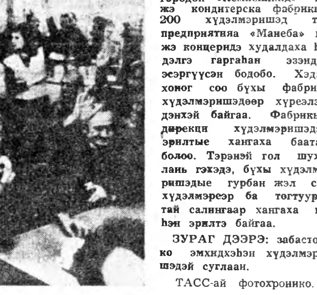
ГОЛЛАНДИ. Эндхоён городой «Кемпенланд» гэжэ кондитерска фабрикын 200 хүдэлмэришэд тус предприятая «Манеба» гэжэ концериде худалдаа эдэлгэ гаргаһан эздэдэ эсэргүүсөн болобо. Хэдэн хоног соо бүхэ фабрика хүдэлмэришэдөөр хүрээлэгдэнхэй байгаа. Фабрикын дирекция хүдэлмэришэдэй эрьилте хантага баатый болоо. Тэрэнэй гол шуухала гээдэ, бүхэ хүдэлмэришэдые гурбан жэл соо хүдэлмэришэ ба тогтууртай салингаар хантага гэгэн эрьлэтэ байгаа.

Лон Нолой радиогоор үгэ хэлэхэнэй һүүлээр оройдоол хоёр часай үнгөрһон хойно аэропортто бууда. Хотын квартал бүхүдэ бөхилгэнуудые бариха гэгэн захиралта Пномпение захиргаанай толгойлогшо городоно засагаархидга үгэһон байна.