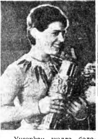
— Унгөрхөн жэлдэ болоһон...