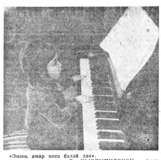
Энэ нь ямар ното бэлэй даа.